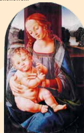
Vierge à l'enfant DI CREDI Lorenzino (Florence 1460 - Florence 1537)

Cette année, elle sera visible à Reichshoffen .